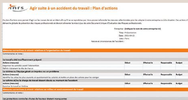
↑ FIGURE 6 Capture d'écran de l'outil : plan d'actions.