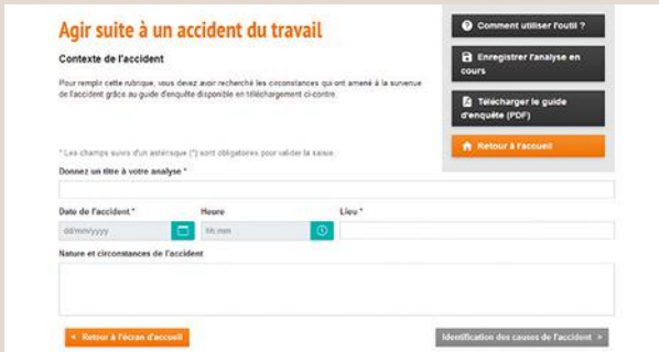
↑ FIGURE 3 Capture d'écran de l'outil : contexte de l'AT.