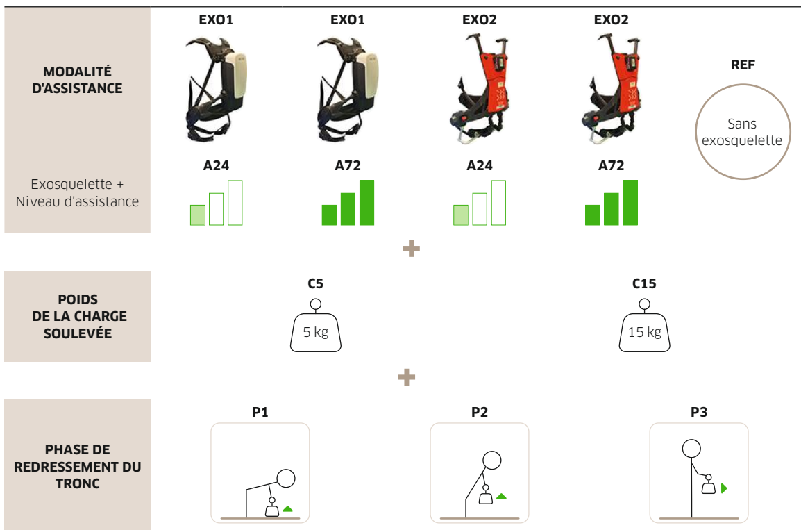
← FIGURE 3 Diagramme du plan expérimental. EXO1 correspond à l'exosquelette Exoback, EXO2 à l'exosquelette CrayX et REF à la condition sans exosquelette. C5 et C15 correspondent respectivement à la charge légère (5 kg) et lourde (15 kg). P1, P2 et P3 représentent les différentes phases du mouvement réalisé lors du soulèvement de la charge et de son déplacement vers l'avant.

ainsi qu'un accéléromètre positionné latéralement sur la cuisse droite ont permis d'évaluer l'angle de flexion des hanches (angle entre la cuisse et L5) de même que la courbure du dos, au travers de l'angle de flexion lombaire (angle entre L5 et T8) et de l'angle de flexion thoracique (angle entre T8 et C7). Le capteur placé au niveau de C7 a également été utilisé afin de déterminer l'inclinaison globale du tronc par rapport à la verticale. Ces données d'inclinaison ont ensuite permis de diviser le mouvement d'élévation de la charge en trois phases successives (Cf. Figure 1) :