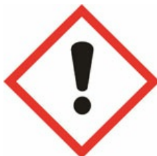
ACÉTATE DE 2-BUTOXYÉTHYLE