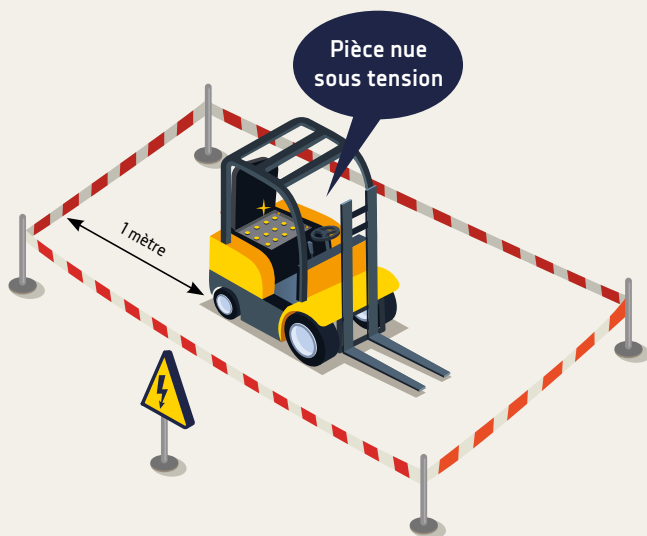
Zone de voisinage avec balisage : 1 mètre