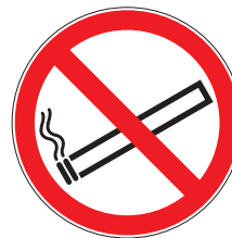
Défense de fumer

Pour en savoir plus : Signalisation de santé et de sécurité au travail. Réglementation, INRS, ED 6293.