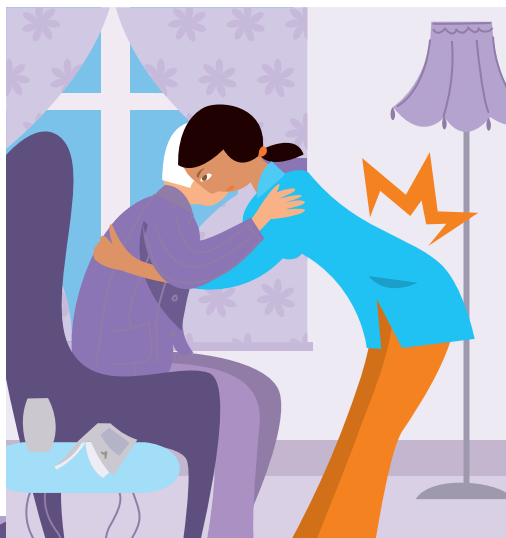
DOULEURS AU DOS ET AUX ARTICULATIONS