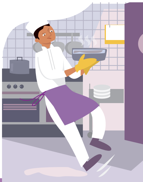
CHUTES EN CUISINE ET EN SALLE