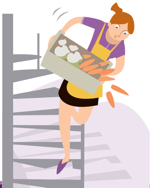
CHUTES DANS LES ESCALIERS