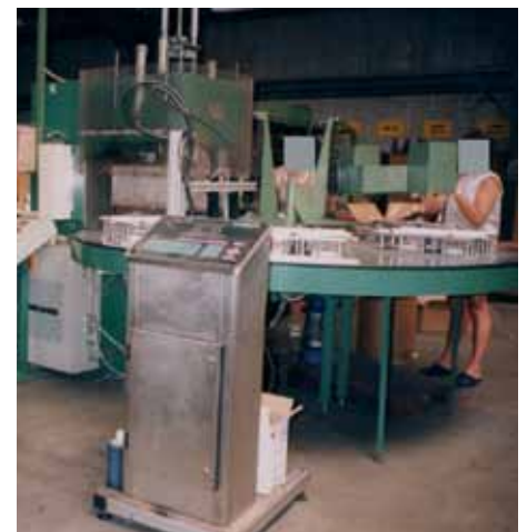
Photo 6. Exemple de réduction de l'exposition par utilisation d'un carrousel d'alimentation.