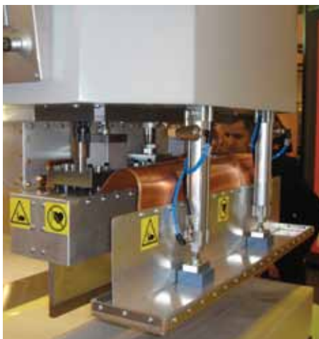
Photo 4. Exemple de machine équipée d'un patin de masse.