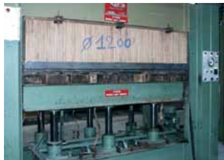
Photo 1. Exemple de machine servant au cintrage du bois.