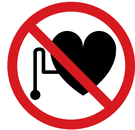
Pour interdire l'accès aux porteurs d'implant actif (stimulateur cardiaque)