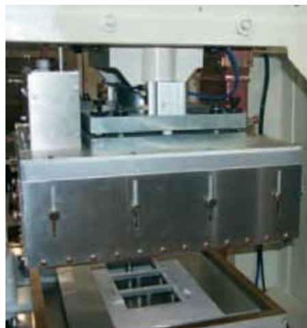
Photo 5. Exemple de blindage d'une zone de soudage.