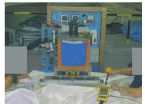
Photo 3a et 3b. Deux exemples de presses fortement rayonnantes aux postes de travail.