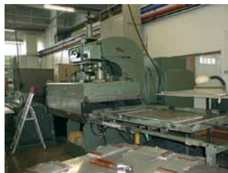
Photo 2. Exemple de machine pour le soudage du plastique, blindée et équipée d'une navette.