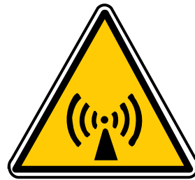
Pour avertir de la présence de rayonnements non ionisants